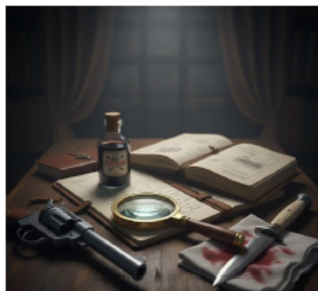
Immagine generata con IA