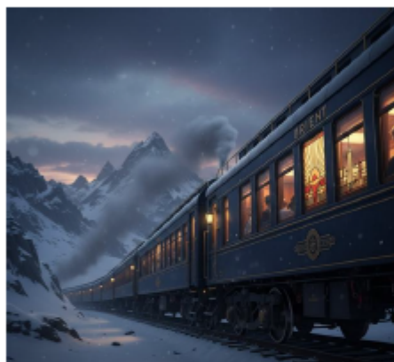
Immagine generata con IA