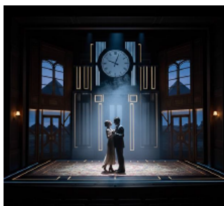
Immagine generata con IA